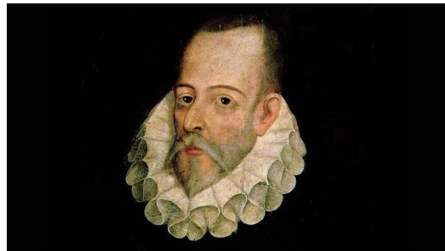
Miguel de Cervantes Saavedra

Además, debe presentar otra herida, más grave, recibida en el pecho por proyectil de arcabuz. «Los huesos de la caja torácica sufrirían por el impacto. Las marcas dejadas por la lesión, junto con la cauterización y posibles restos microscópicos de metal confirmarían la identidad», argumenta el historiador, que dirige el proyecto